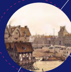
ART ET CULTURE