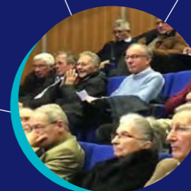
SCIENCES ET TECHNIQUES